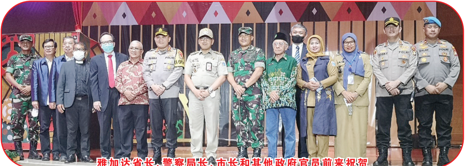
雅加达省长、警察局长、市长和其他政府官员前来祝贺

人嫌弃和抛弃,而上帝就像那修复玩具的老人一样,一针一线地修补玩具破坏之处,使玩具焕然一新一样,讨别人的欢喜并成为祝福。