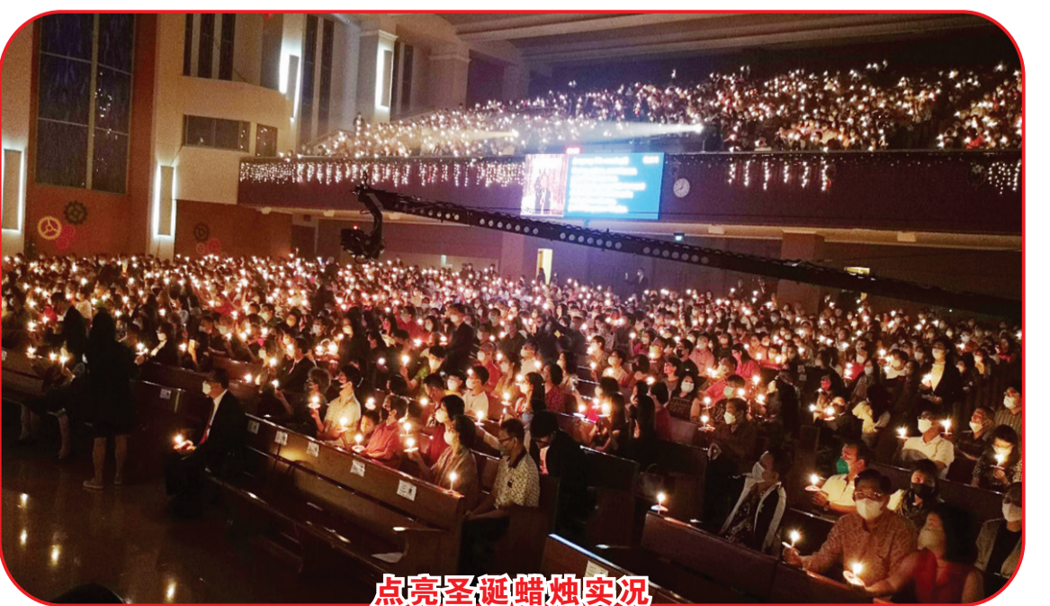
点亮圣诞蜡烛实况